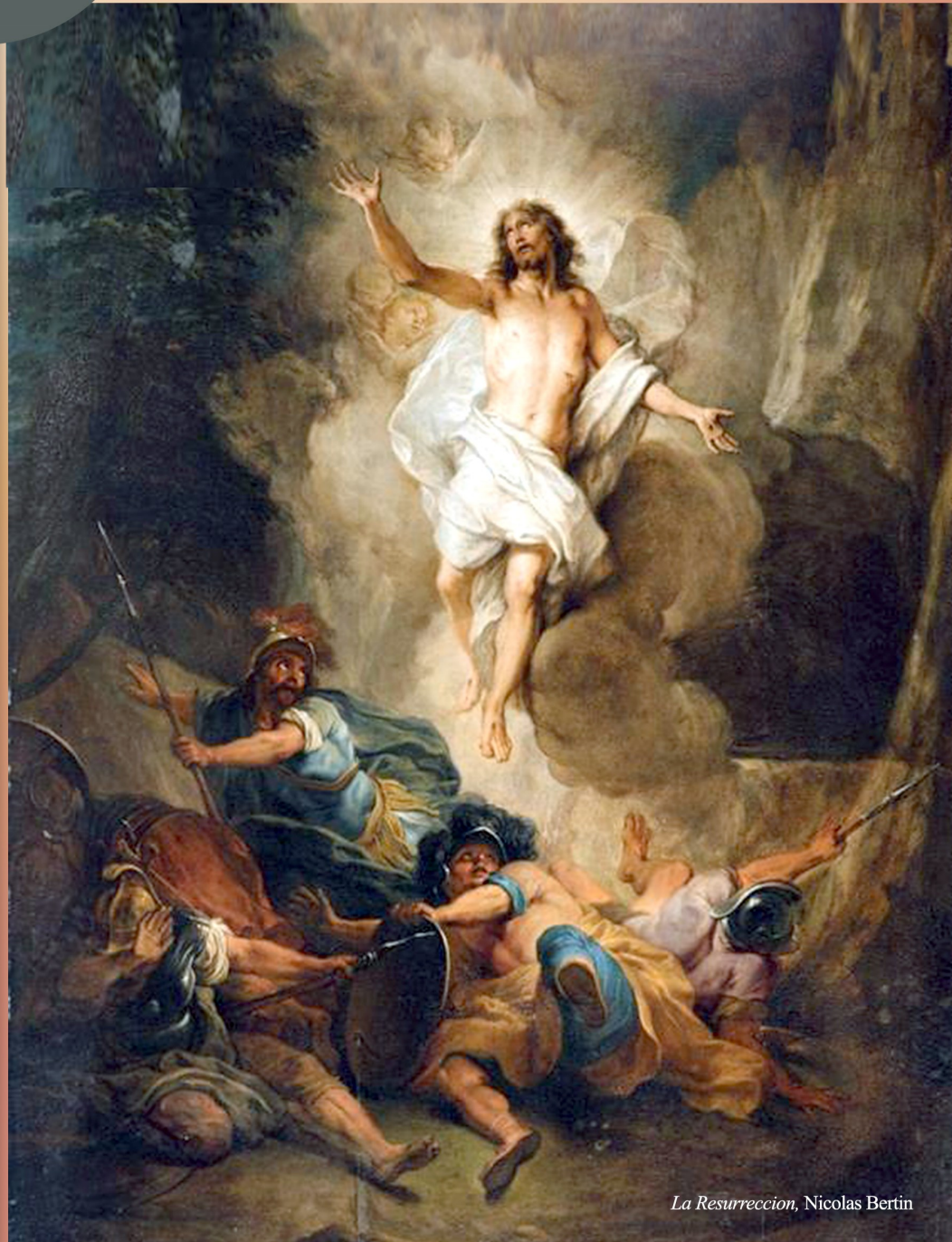
La Resurrección, Nicolas Bertin